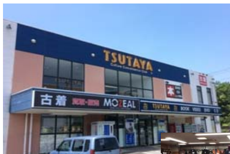
MO-ZEAL 村岡店 (店内)