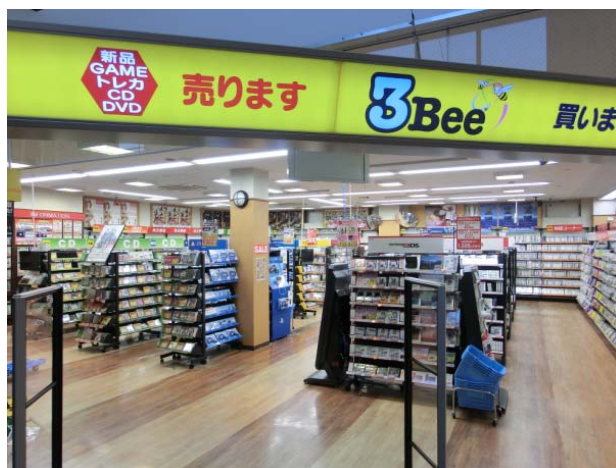
3Bee 村岡店 (2012 年 3 月 15 日オープン、神奈川県)