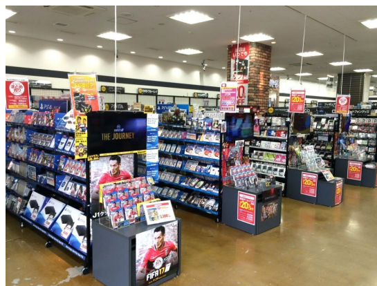
古本市場 藤原台店