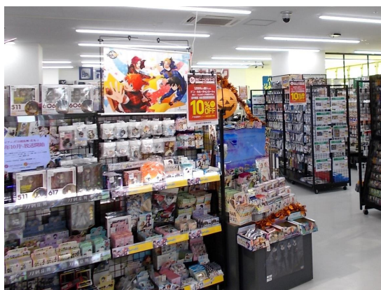
ホビー・トレカパーク藤沢店