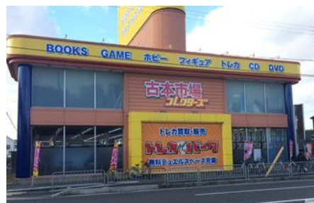
古本市場 西神戸店