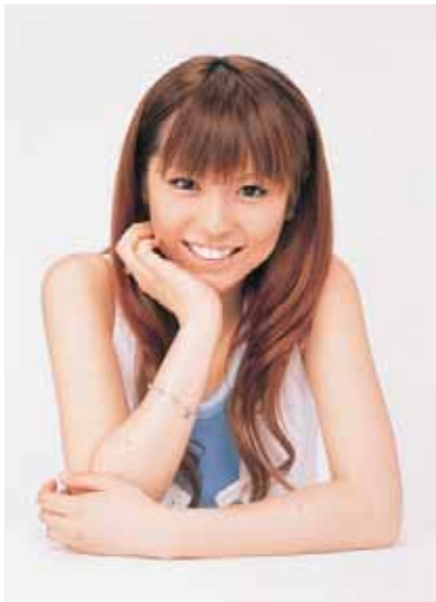
キャンペーン タレント “若槻千夏”さん

当社は今夏キャンペーンイメージタレントとして「若槻千夏」さんを起用しました！ 今やバラエティーやドラマに引っ張りだこの彼女を、テレビCM/Webサイト/新聞折込チラシなどのメディアで強力露出し、より多くのお客様にキャンペーンを訴求してまいります。