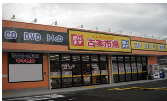
古本市場 高槻春日町店