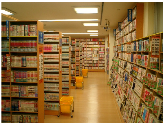
古本市場 新小岩店

10/2 期の 2Q 累計は \Delta 5.4\% であるが、7 月以降は プラス で推移。