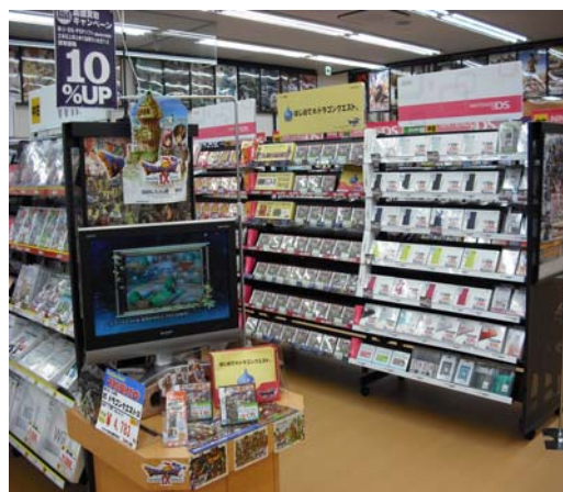
古本市場 高槻春日店