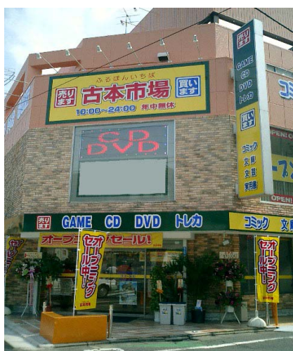
古本市場 新小岩店

当社は、今後も店舗ビジネスの根幹である新規出店を行うことにより古本市場の店舗網拡充と同時に、店舗改装や新商材取扱い等により既存店舗の店舗競争力の向上を図り、当社の企業理念である「満足を創る」を実現すべく努力してまいります。