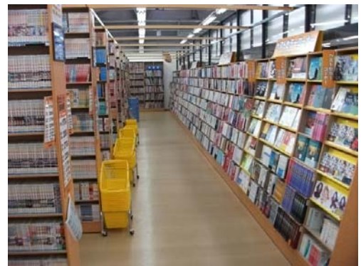
古本市場 春日部緑町店