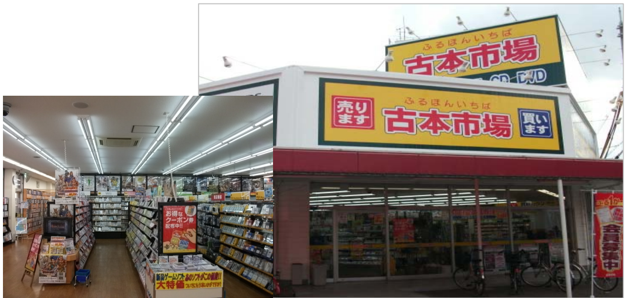
古本市場 長吉長原店

当社は、今後も店舗ビジネスの根幹である新規出店を行うことにより古本市場の店舗網拡充と同時に、店舗改装や新商材取扱い等により既存店舗の店舗競争力の向上を図り、当社の企業理念である「満足を創る」を実現すべく努力してまいります。