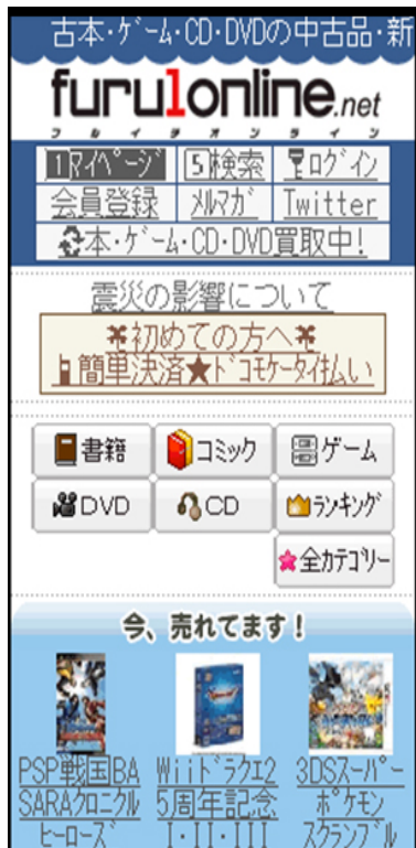
※モバイルサイトイメージ (スマートフォンも対応)

当社は連結子会社であった株式会社ユーブックを通じて2000年よりECサイトを展開しており、2009年にはユーブックを合併し、事業統合したことにより、商材コントロールの一元化及び業務効率化を進め、業績拡大を実現しております。今般のサイトリニューアルにより、当社のECチャネルでの更なる業績拡大を追及いたします。