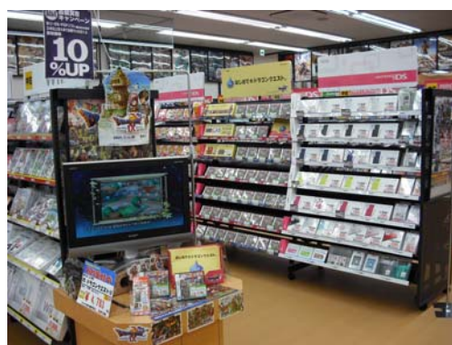
古本市場 高槻春日町店