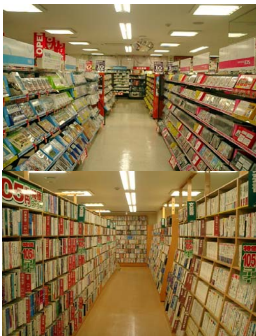
古本市場 新小岩店