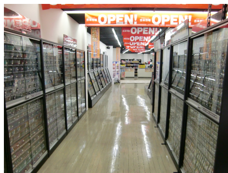
トレカパーク日本橋2号店