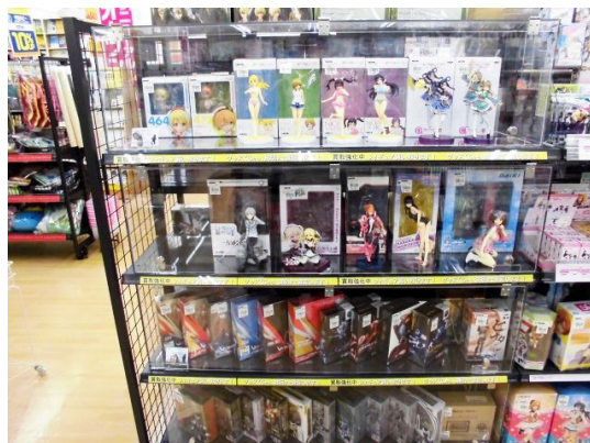
古本市場 与野本町店