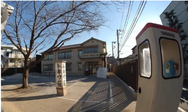
(トキワ荘マンガミュージアム外観)