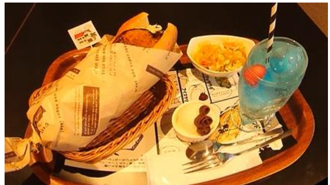
(トキワ荘青春セット) ※カフェ・リベッチオ様