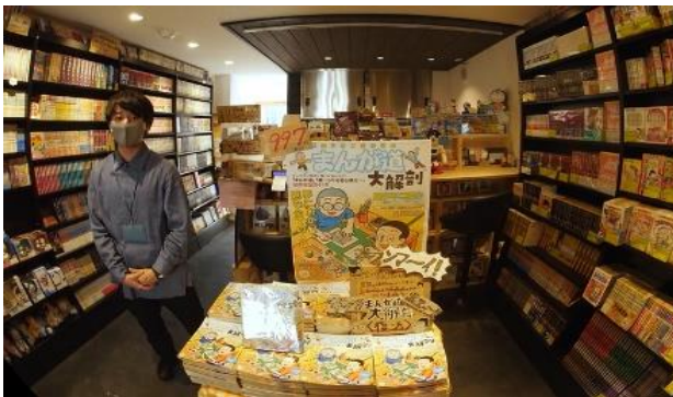
(ふるいち トキワ荘通り店)